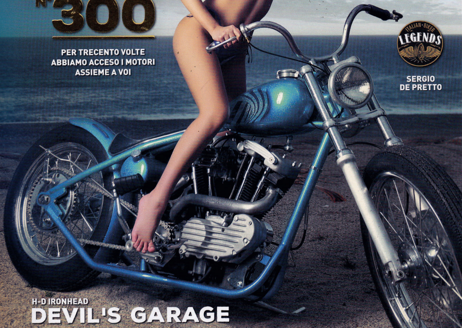
H-D IRONHEAD DEVIL'S GARAGE