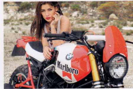
BMW R NINET LUISMOTO