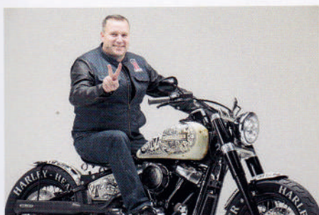
H-D SOFTAIL SLIM HARLEY-HEAVEN BÄCHLI / 70's